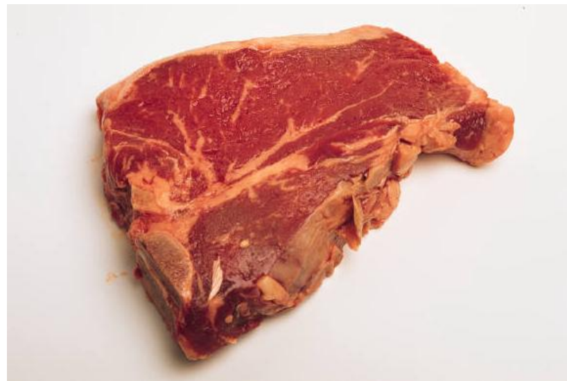
(o) bife de vaca