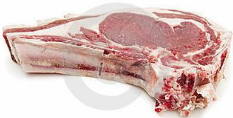
(a) costeleta de vitela