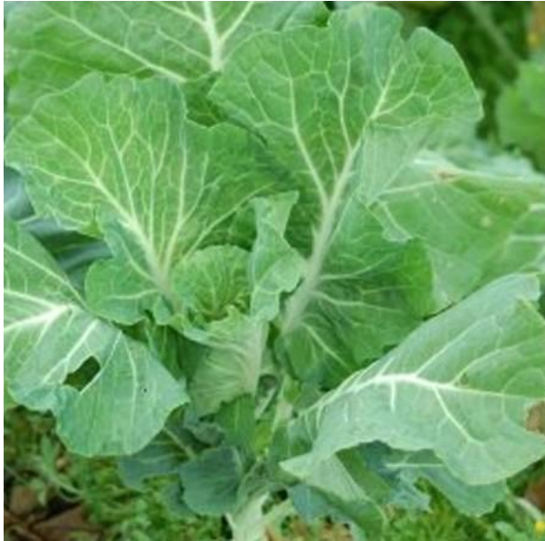
(a) couve portuguesa