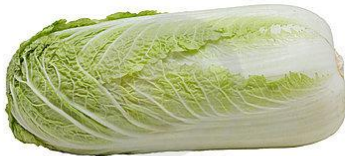
(o) repolho Napa