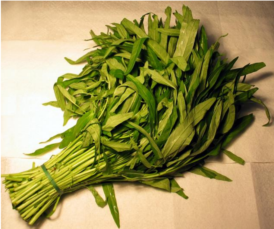
(o) espinafre de água tong choi