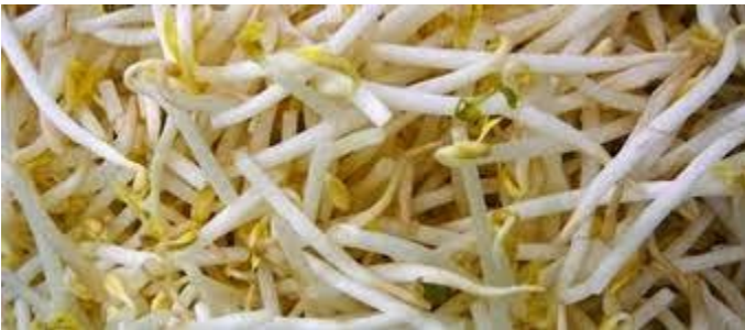
(os) rebentos de soja