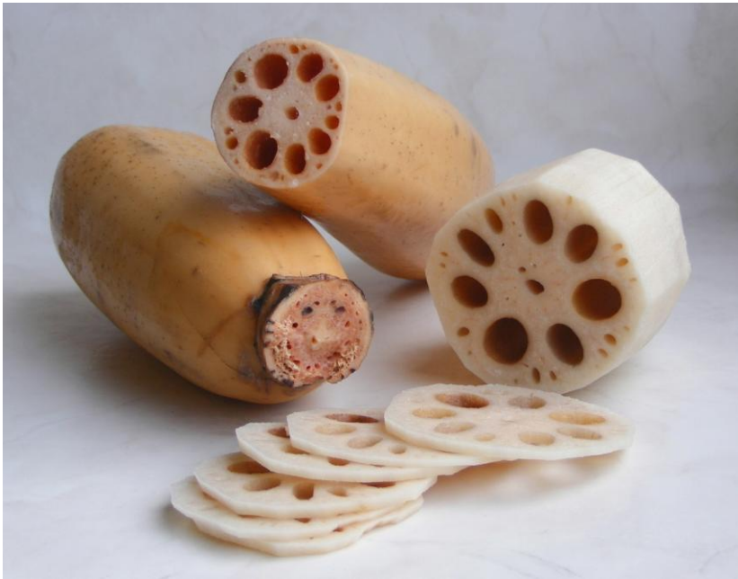
(a) raiz de lótus