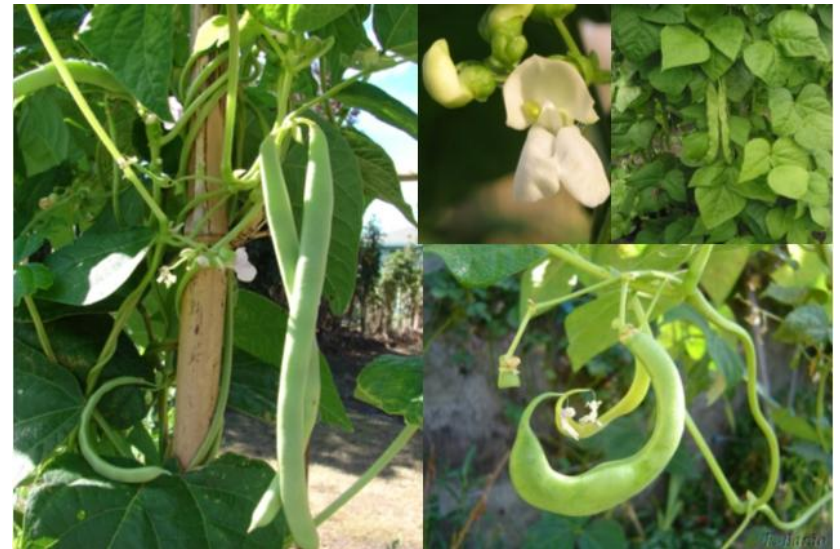
(o) feijão verde