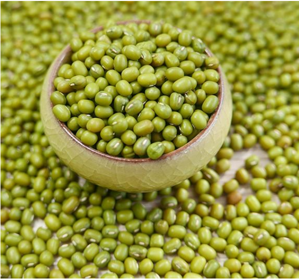
(o) feijão mungo