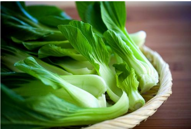
(a) bak choy