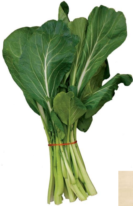
(a) choi sum