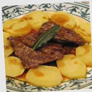
iscas com elas