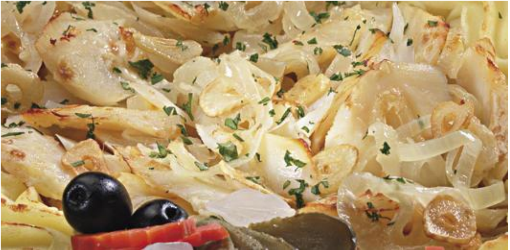
Bacalhau à Zé do Pipo