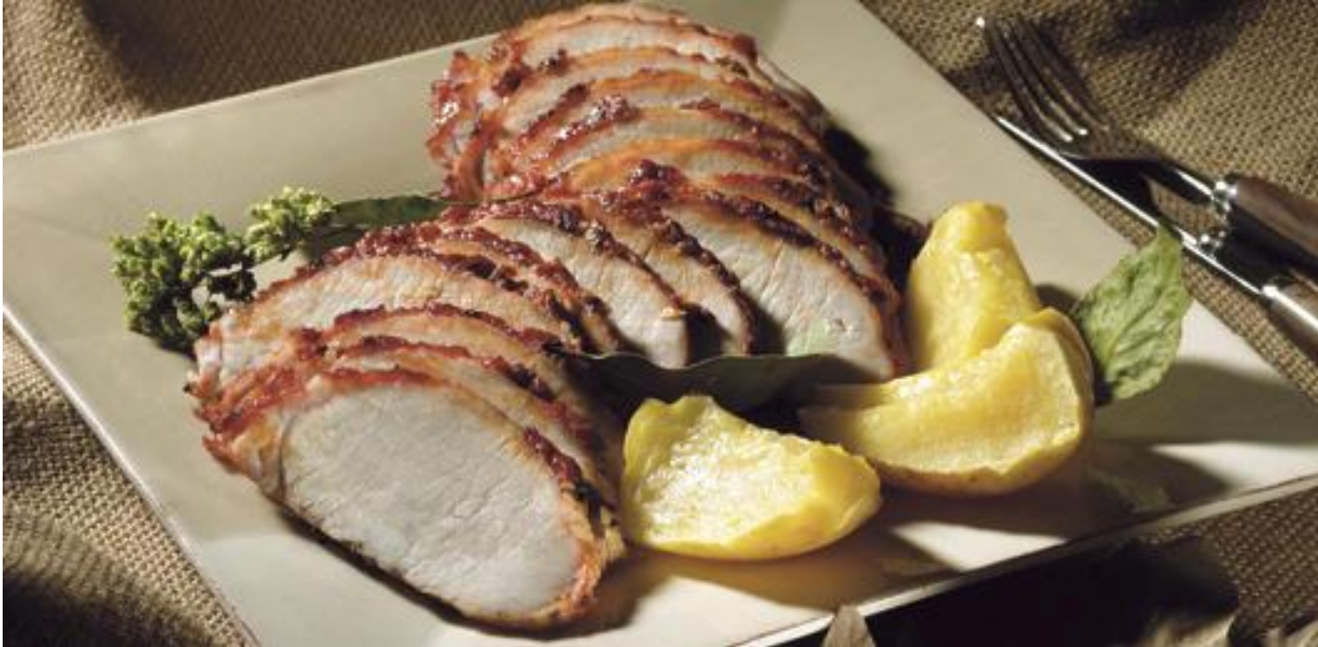
Lombo de porco assado