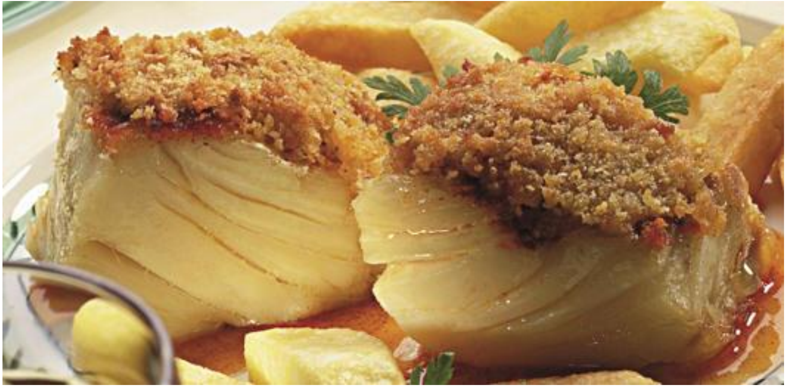
Bacalhau com broa