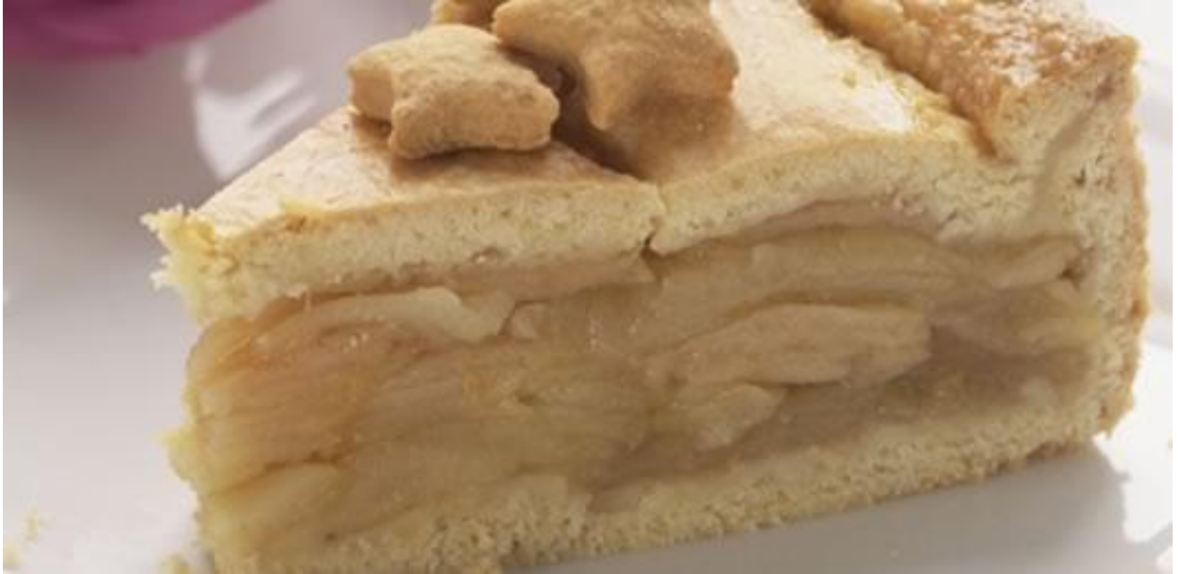
Tarte de maçã