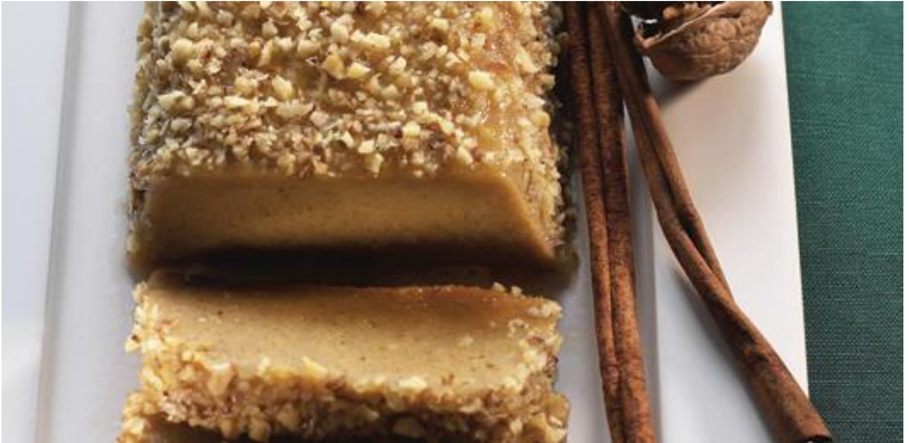
Pudim de ovos