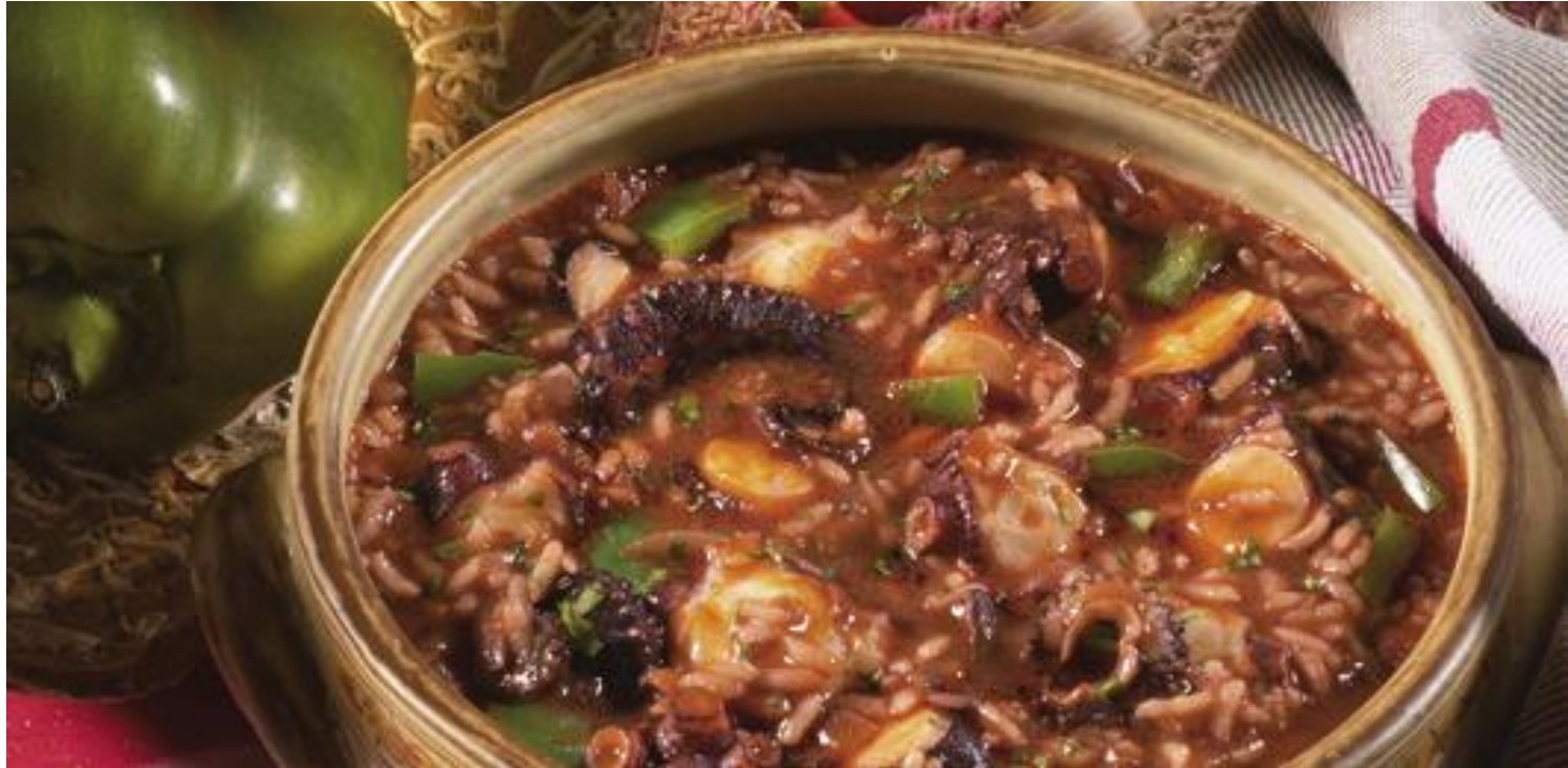
Arroz de polvo